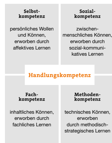
Abbildung 1: Die vier Komponenten der Handlungskompetenz (in Anlehnung an Lehmann & Nieke, 2005)

Handlungskompetenz setzt sich aus verschiedenen Kompetenzen zusammen: